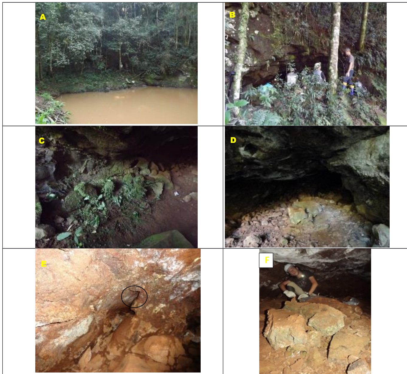
Figura 3: A caverna do Pau Oco de vários ângulos

Legenda: A) O meio externo no qual o abrigo do Pau Oco se encontra; B) Mais próximo da entrada da cavidade; C) Detalhe da parede da cavidade estando marcado espeleotema. D) Observa-se grande quantidade de blocos abatidos no chão; E - F) O interior do abrigo do Pau Oco – Fotos: Angelo Spoladore (2015)