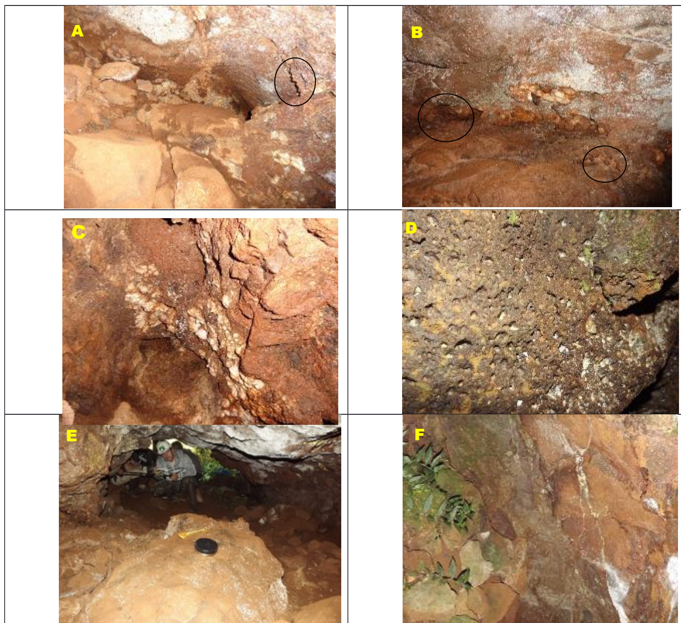
Figura 4: Características espeleológicas/geológicas da caverna do Pau Oco

Legenda: A) Bloco abatidos com espeleotema; B) Veio de quartzo com espeleotemas; C) Fratura com quartzo cristalizado; D) Estruturas não preenchida; E) Veio de quartzo em meio a rochas com vesículas; F) Quartzo preenchendo fraturas - Fotos: Angelo Spoladore (2016).