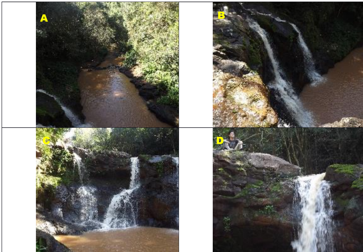
Figura 5: Salto das Antas

A – Vista de cima da Cachoeira revelando um vale bem encaixado sobre rochas vulcânicas; B- Visão Lateral das quedas da cachoeira; C-D Visão frontal da Cachoeira e a estruturação dos basaltos da Formação Serra Geral.